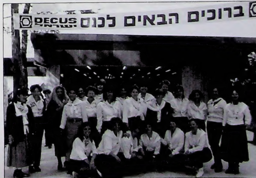
אחת בעד כולן - וכולן בעד אחת