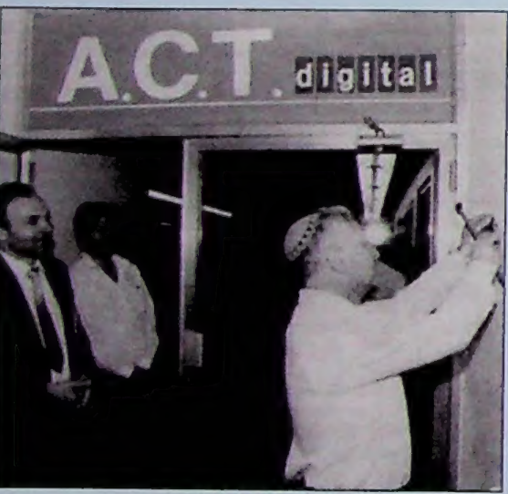
מרכז היישומים יוצא לדרך 17.2.87